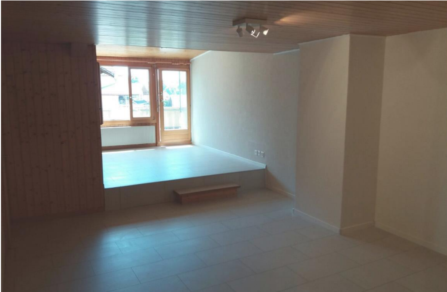
Bild1: Wohnzimmer mit Boedeli