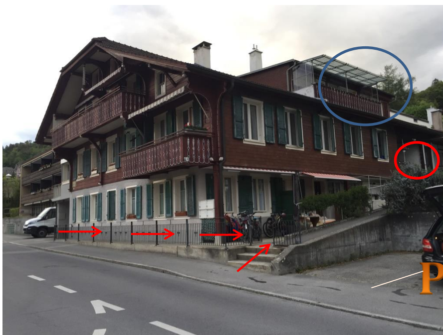
Gebäudefront Südost: Aussichtsplatz der ausgeschriebenen Wohnung ist blau und der Aufgang rot markiert. (P= Parkplatz)