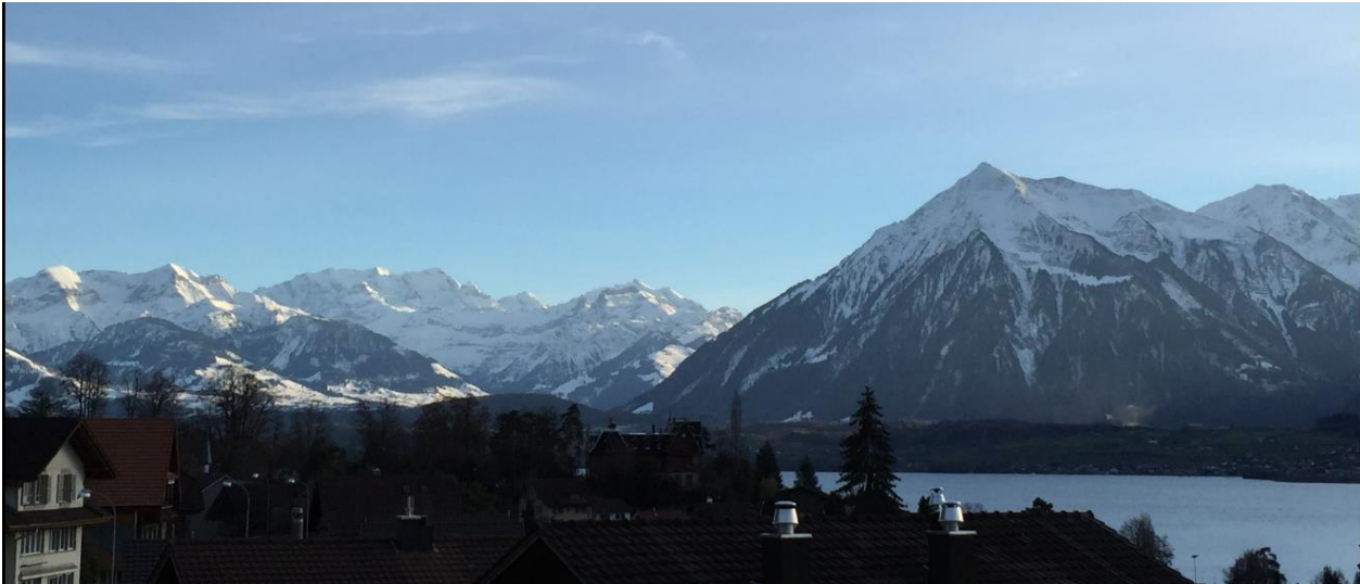
Bild oben: Blick von der Wohnungsterrasse in Richtung Niesen und Blümlisalp

Im steuergünstigen Hünibach/Hilterfingen am Thunersee, vermieten wir in unserem Elternhaus eine schöne 3 ½ Zimmer Wohnung. (+)